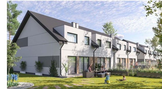
Widok budynku od strony działek