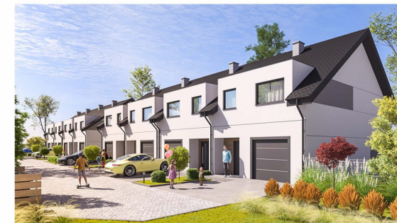
Widok budynku od strony ulicy